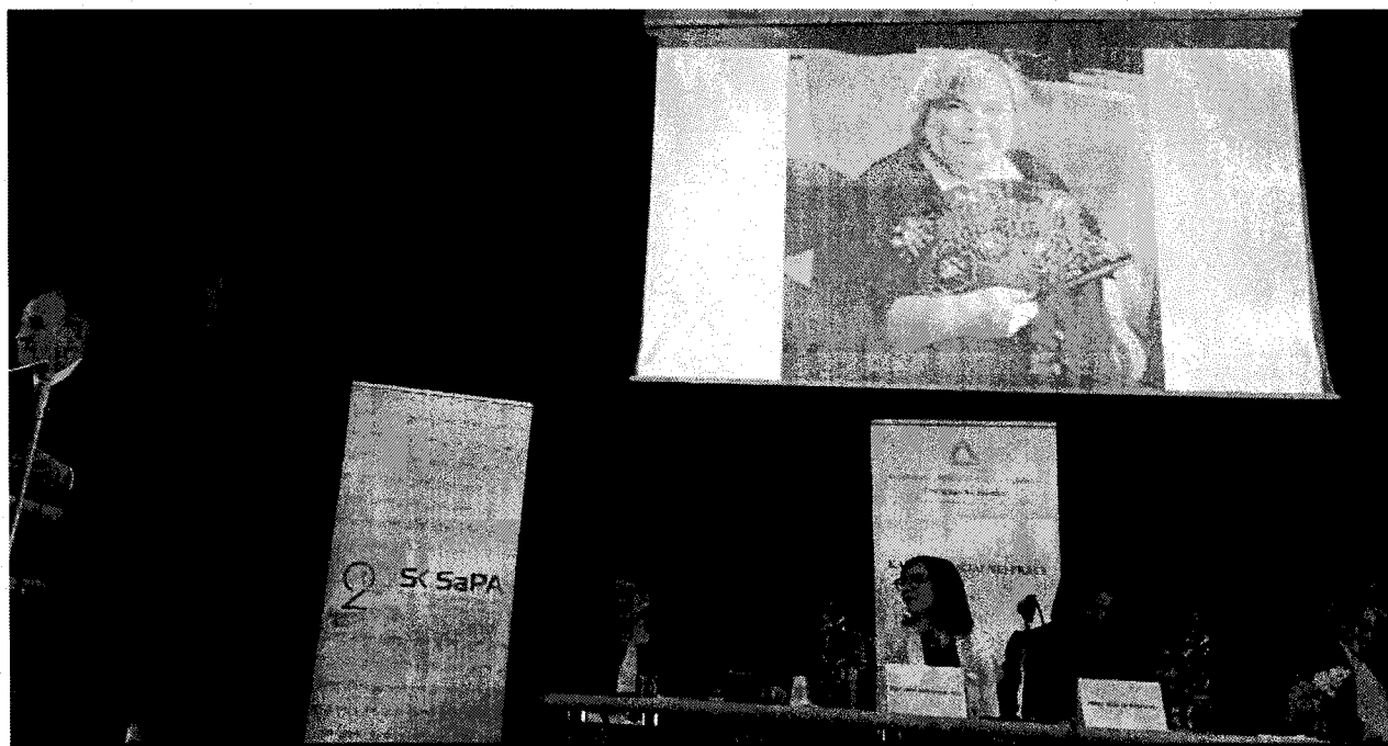
Foto 1 Prihovory hostí k účastníkom konferencie