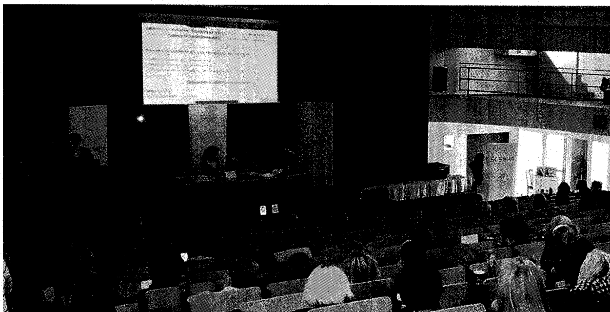
Foto 2 Odborné prednášky