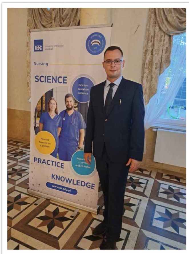
Počas jednej z aktívnych účasť na konferencii v Poľsku, zdroj archív M. Červeného

Už od malička som mal záujem o prácu v zdravotníctve. Spomínam si, ako sme sa so súrodencami hrali na zdravotníkov a pacientov. Podával som injekcie (čistou vodou naplnené striekačky) a pravidelne ich očkovoľ proti chorobám. Aj keď sme len napodobňovali