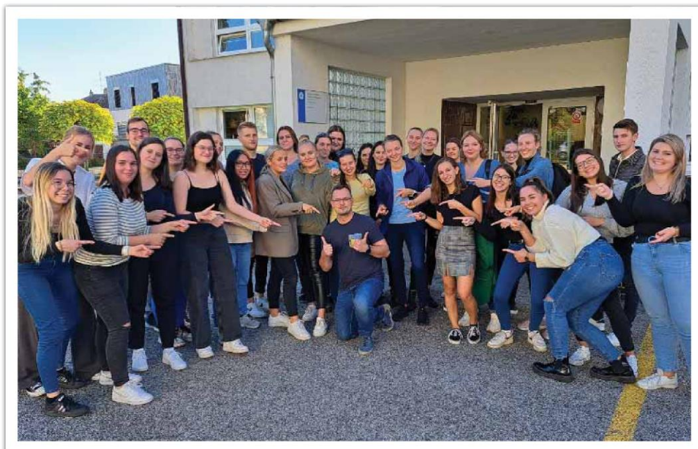
So svojimi študentami na FZS v Českých Budějoviach

čiek a celkovou dialyzačnou liečbou. Od mojich bývalých spolupracovníkov som sa veľa naučil. Tieto skúsenosti ma profesionálne formovali pri starostlivosti o dialyzovaných pacientov. Som nesmierne hrdý, že som mohol byť členom tohto tímu. Dodnes máme dobré vzťahy a sme v kontakte. Nemôžem zovšeobecniť a povedať, že práca v ženskom kolektíve je v niečom ťažká. Ale je pravda, že má svoje výhody aj nevýhody.