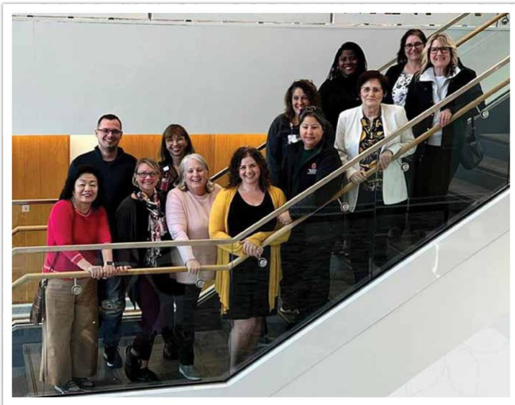
Účastníci kurzu Evidence Based Practise v USA

uviedomil som si, že som tu, kde som chcel byť. Nenadarmo sa hovorí, že: „v Českých Budějoviciach by chcel žiť každý“.